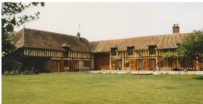
la ferme musée rustique